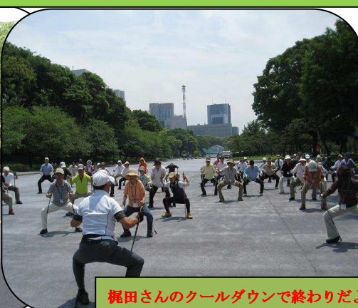
梶田さんのクールダウンで終わりだよ