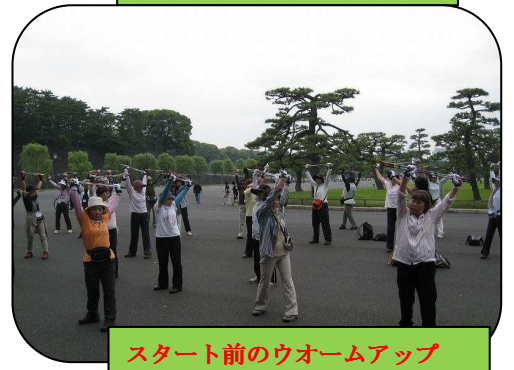
スタート前のウォームアップ