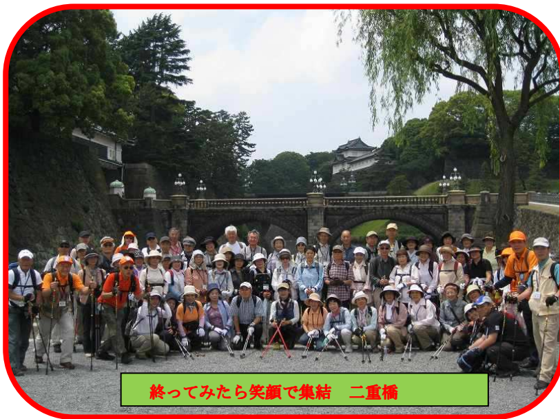
終って見たら笑顔で集結 二重橋