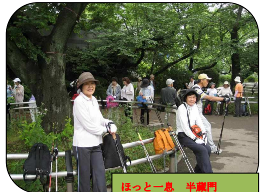
ほっと一息 半蔵門