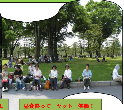
昼食終って ヤット 笑顔!