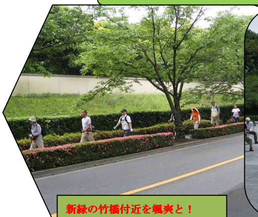
新緑の竹橋付近を颯爽と!