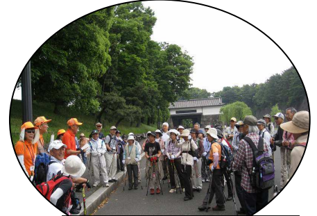
桜田門前; 東リーダーの挨拶