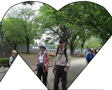
ご夫婦仲良く ノルディック